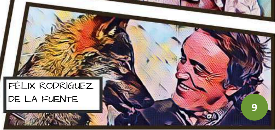
FÉLIX RODRÍGUEZ DE LA FUENTE