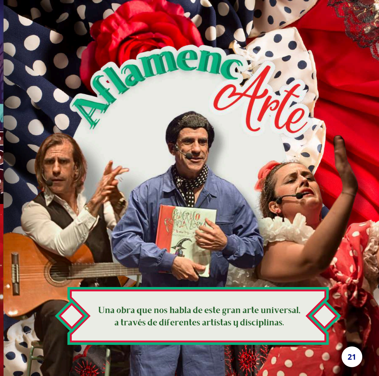
Una obra que nos habla de este gran arte universal, a través de diferentes artistas y disciplinas.